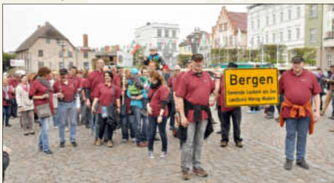
Hinter dem Ortsschild ziehen die Bergener beim Umzug durch Bergen auf Rügen.

Hier wurde ein reichhaltiges Programm geboten. Für uns, über 50 Personen, war es eine Strecke von 970 Kilometer. Bei der Heimfahrt war Stau ohne Ende.