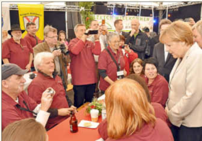
Hoher Besuch bei den Saarländern Bundeskanzlerin Angela Merkel bei den Bergener im Festzelt.