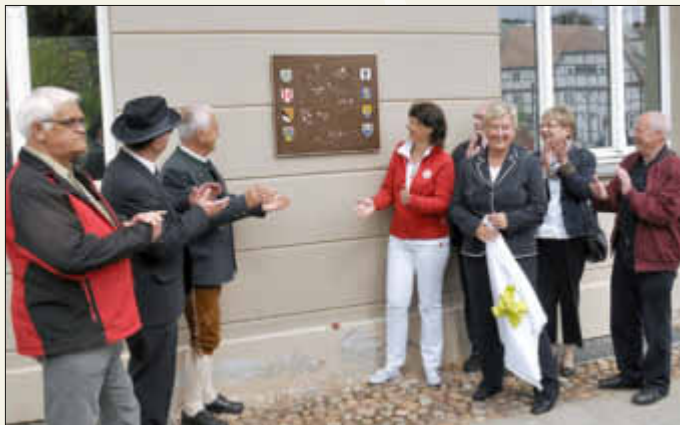
Das Gastgeschenk für Rügen, eine Bronzetafel, Deutschland mit den einzelnen Bergen und Wappen

Zum 10. Mal fand das Bergentreffen dieses Jahr auf der Insel Rügen statt. Seit 1995 findet alle zwei Jahre dieses Treffen reihum in einem der acht deutschen Orten statt, die den Namen Bergen tragen. Dies sind Bergen auf Rügen, Bergen an der Dumme, Bergen Elsterheide, Bergen Celle, Bergen Enkheim, Bergen Nahe, Bergen Saar und Bergen Chiemgau. Über 700 Bergener kamen aus allen Richtungen zum großen Fest nach Rügen.