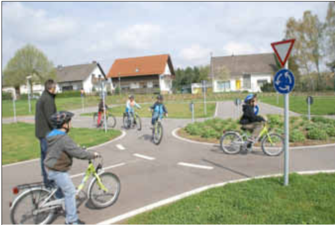
Auch Fahrradfahren im Kreisverkehr will gelernt sein.

Ende des dritten oder Anfang des vierten Schuljahres findet an der Grundschule Losheim im Rahmen des Sachunterrichts das »freie Fahrrad-Training an der stationären Jugendverkehrsschule in Britten« statt. Hier können die Schüler das Fahrradfahren im Straßenverkehr erlernen, ohne der Gefahr des richtigen Verkehrs ausgesetzt zu sein. Dieser Parcours in Britten auf dem ehemaligen Schulhof der Grundschule wurde vor zwei Jahren neu eingerichtet, damit für die Grundschüler des Kreises ein zentraler Übungsplatz vorhanden ist. Mit der Anlegung dieses Platzes gab es auch eine neue optimale Ausrüstung für die Kinder. Es wurden neue Fahrräder und Helme angeschafft, damit die Schüler die besten Bedingungen zum Trainieren haben.