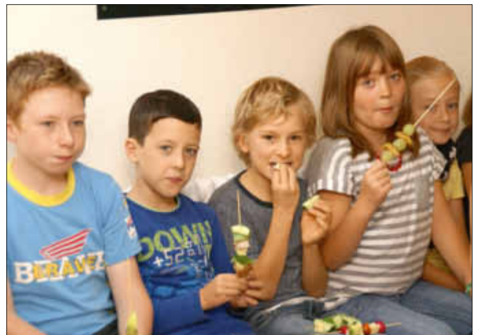
... und lecker war es auch.

Zur großen Pause präsentierten die Schülerinnen und Schüler ihr Werk in Form eines großen Büfetts, welches in den Räumlichkeiten der freiwilligen Ganztagschule aufgebaut wurde. Beeindruckt vom Angebot griffen die Kinder allesamt beherzt zu. Auch Schulleiter Traut hob die Wichtigkeit dieser Aktion hervor, denn schließlich solle für eine qualitativ hochwertige Schulverpflegung sensibilisiert werden, die nebenbei noch lecker schmeckt und für gute Laune und Zufriedenheit sorgt. Zum Abschluss lobte er die Schülerinnen und Schüler für die hervorragende Umsetzung und bedankte sich bei den anwesenden Eltern, den Vertreterinnen der SaarLandFrauen und allen Helfern und Unterstützern.