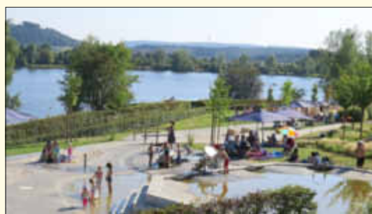
Wasserspielplatz im SeeGarten

Am Sonntag, dem 18. Juni findet der erste Familien-Wander- und Erlebnistag am Stausee Losheim statt. In einem erlebnisreichen Umfeld können Familien einen Tag mit Wandern, Spazieren, Kultur, Kulinarik und Spielen verbringen.