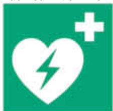
Hinweisschild für Defibrillatoren