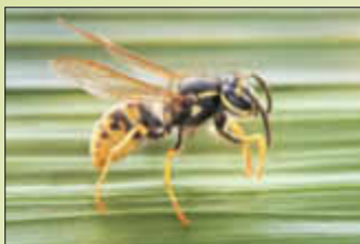
Deutsche Wespe