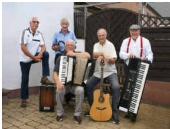
Band Toscanis