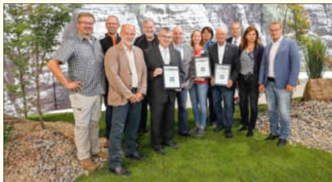
Übergabe der Urkunden an die Vertreter der drei Premium-Wanderregionen auf der TourNatur in Düsseldorf

Kontakt: Wanderbüro Saar-Hunsrück, Zum Stausee 198, 66679 Losheim am See, Telefon 06872 9018100, info@saar-hunsrueck-steig.de , www.saar-hunsrueck-steig.de