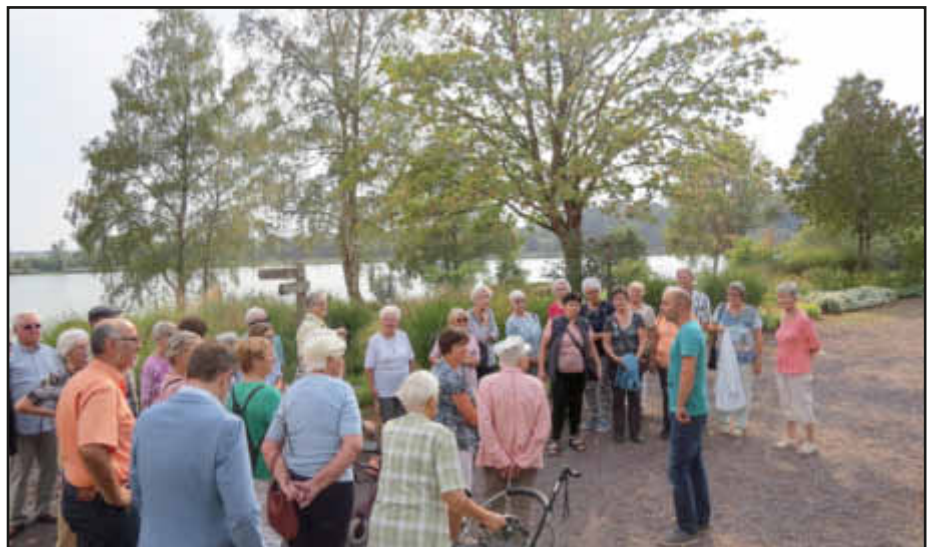
Gartenführung mit zahlreichen Gästen durch den SeeGarten.

An dieser Stelle nochmals ein herzliches Dankeschön an alle, die zur Durchführung und Gestaltung des Tages beigetragen haben: der Sparkasse Merzig-Wadern für die finanzielle Unterstützung; der Freiwilligen Feuerwehr Löschbezirk Losheim für die Bereitstellung des Mannschaftsbusses; den Mitarbeiterinnen und Mitarbeitern des Eigenbetriebes Touristik, Freizeit und Kultur; den Seniorenbeauftragten sowie den Helferinnen und Helfern vom Verein „Förderung der Seniorenarbeit in der Gemeinde Losheim am See e.V.“ und der Gemeindeverwaltung.