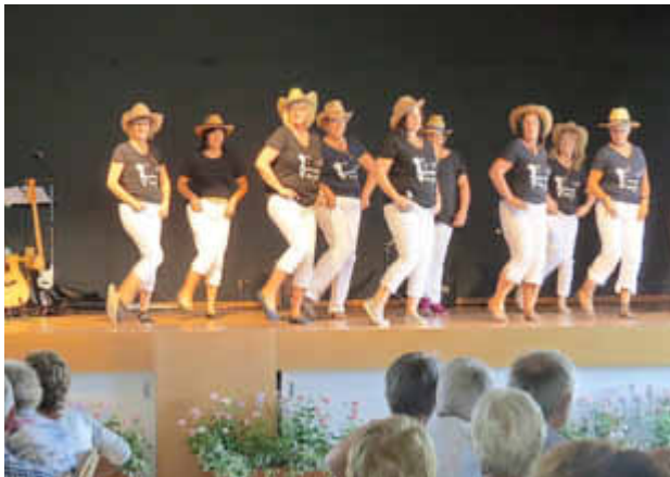
Auftritt der Layendancegruppe.

Beim ersten Schlagernachmittag im Saalbau Losheim durfte der Verein zur Förderung der Seniorenabreit in der Gemeinde Losheim am See e.V. als Gastgeber sich über eine große Besucherschar freuen.