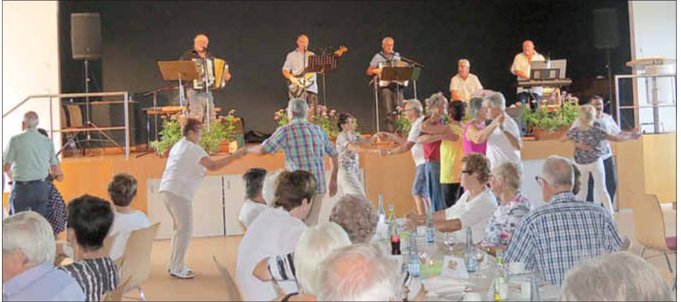
Ausgelassene Stimmung mit der Hobbyband „Toskanis“.

Das Tanzbein durfte kräftig geschwungen werden