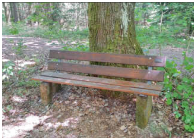
Die neue Ruhebank im Mai 2020