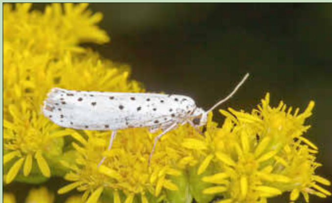
Gespinstmotte auf Pfaffenhütchen

Zurzeit gehen bei der Gemeindeverwaltung wieder vermehrt Anrufe von Bürgern ein, die sich Sorgen darüber machen, dass Bäume und Sträucher kahlgefressen und mit einem silbrig-weißen Gespinst überzogen sind. Häufig sind die Bürger besorgt, dass es sich um Eichenprozessionsspinner handeln könnte. Die dichten Fäden stammen aber von der Gespinstmotte. Besonders betroffen sind Wildgehölze. Die Raupen der Schmetterlingsart befallen Apfel, Birne, Pflaume, Weiß- und Rtdorn sowie Traubenkirsche und Pfaffenhütchen. Teilweise werden ganze Sträucher eingesponnen, was durchaus etwas unheimlich aussieht.