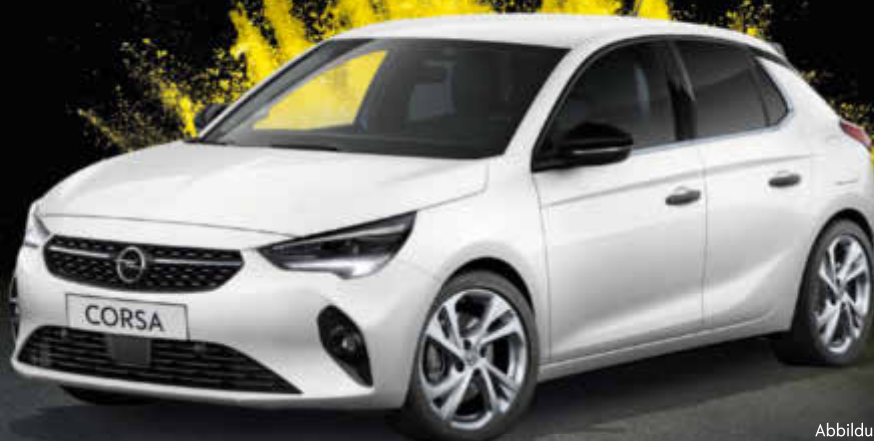
Abbildung zeigt aufpreispflichtiges Zubehör