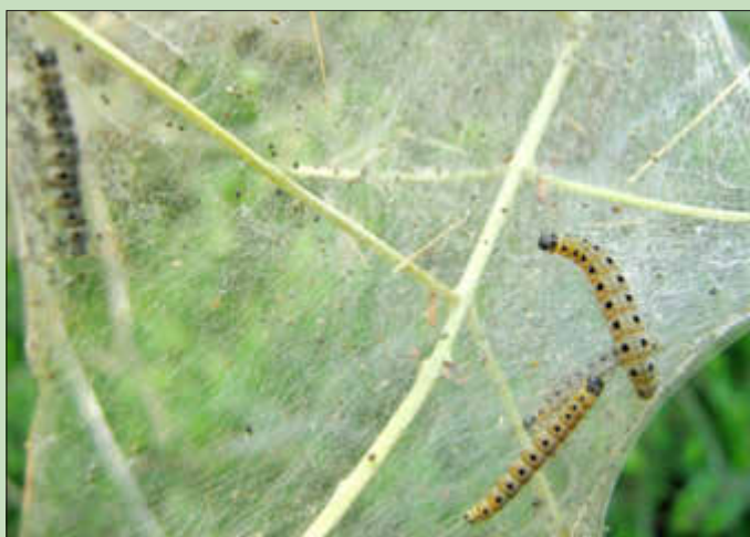
Raupen der Gespinstmotte in ihrem Netz